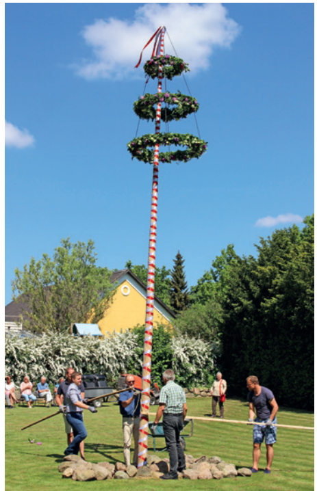
Medlemmer af Sdsr. Nærrå Valgmenighed sætter Majstangen op.

1999: "Snabel Å" etableres som et rindende-vand-arrangement. Og mange flere kunne nævnes.