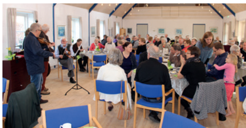
Vi er ikke mange kilometer fra Carl Niensens fødehjem, så selvfølgelig fyldes storstuen ind imellem med musik af spillemandsmusik.

kneb for menigheden at være i præstegården ved folkelige møder. Storstuen bliver i 2003 udvidet med stort industrikøkken og kan lejes af menigheden til private fester.