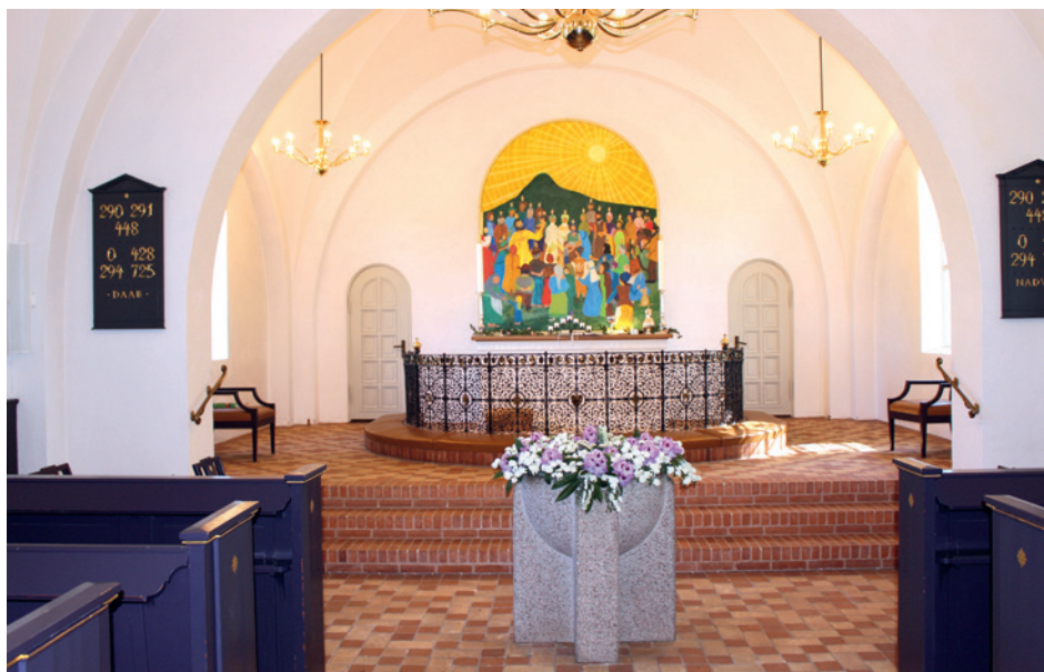
Døbefonden i vidunderlig blomsterpragt leder vejen op til alteret og nadvermåltidet i Sdr. Nærå Valgmenighedskirke.