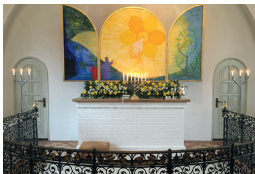
Opstandelseslys og blomsterflor i Sdr. Nærå Valgmenighedskirke.

Storstuen blev indviet d. 9. januar 1994 til at danne ramme om menighedens folkelige liv i glæde og sorg. Det lokale forsamlingshus var blevet inddraget til bibliotek, og det