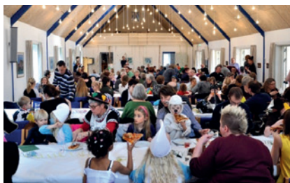
Storstuen danner rammen om menighedens merre sociale aktiviteter - og lejes også ud.