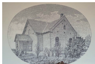
Fotostat af den første udgave af valgmenighedskirken i Sdr. Nærå.

I midten af 1800-tallet var der grøde i det midt fynske. Kresten Kold og hans grundtvigske tanker om skole prægede de små samfund, og der opstod både højskole og friskoler på den baggrund. Stemningen blandt husmændene var, at man ville bestemme selv, og i den ånd opstod Sdr. Nærå Valgmenighed.